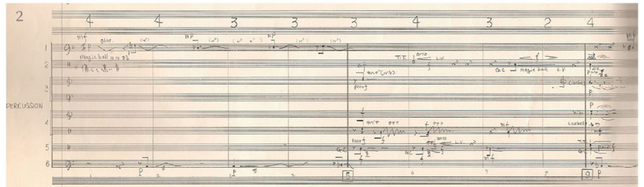
図版1.「コンピュータ・アート展'74」の会場図 図版2.「TAO」のスコア(部分)