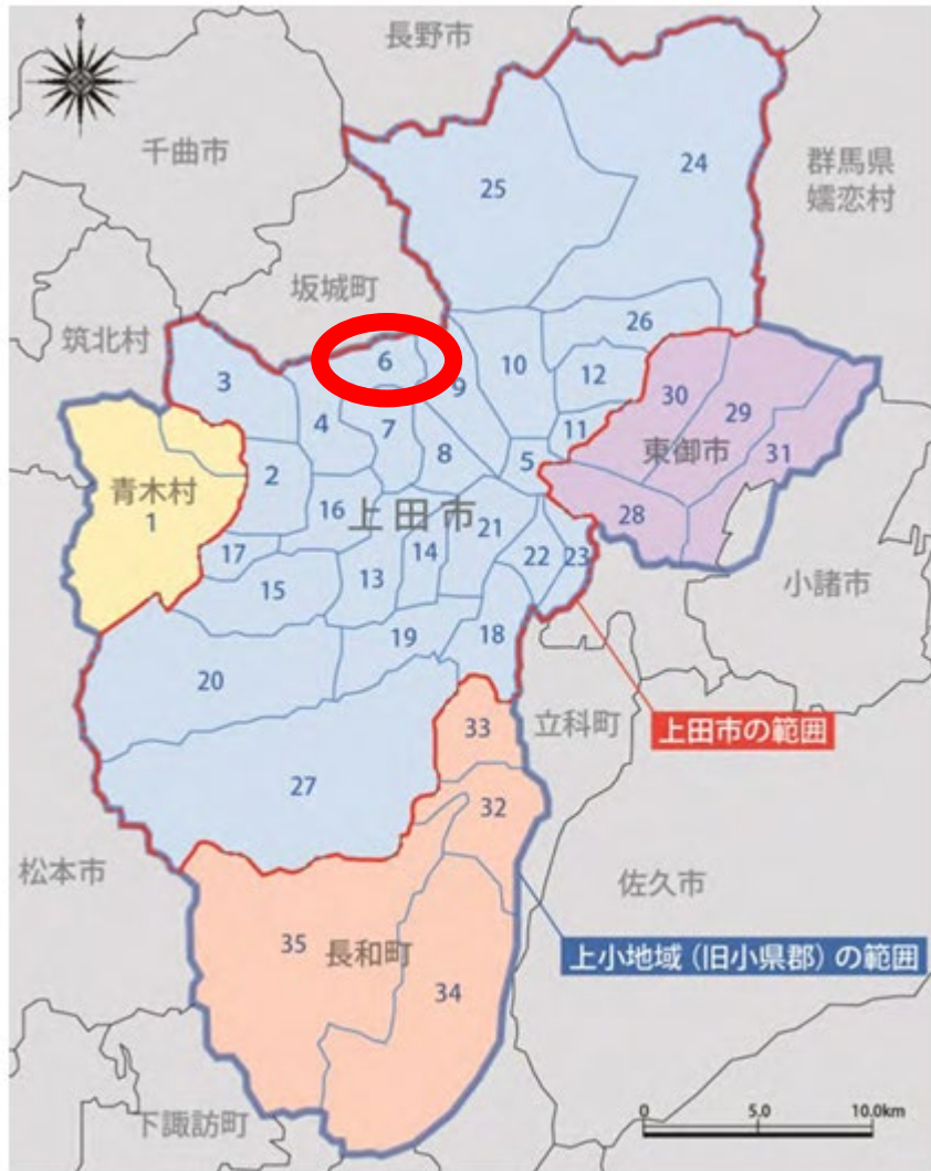
図7 上小地域（旧小県郡）の範囲と上田市の範囲