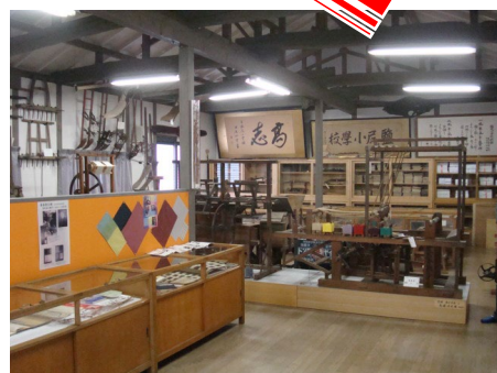
しおじり しょうがっこう きょうど しりょうかん 塩尻小学校 郷土資料館

きょうど しりょうかん むかし 郷土資料館には、昔のしごとやくらしで つか どうく むかし しりょう 使われた道具や昔を知る資料がたくさん ほそん てんじ 保存・展示されています。