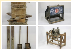
のうぎよう どうく 農業の道具もいろいろ