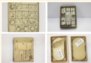
かいに たまご さんしゆ 蚕の卵(蚕種)ってなに？