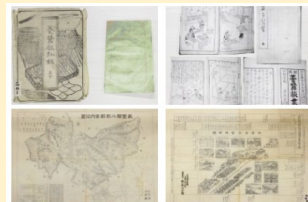
ふる しりょう 古い資料もいろいろ